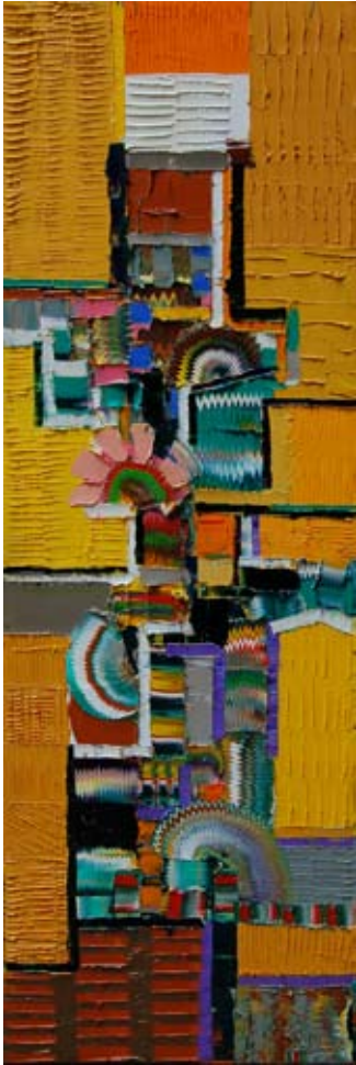
NELU PASCU "Volo", cm 50x150, olio su tela, 2009