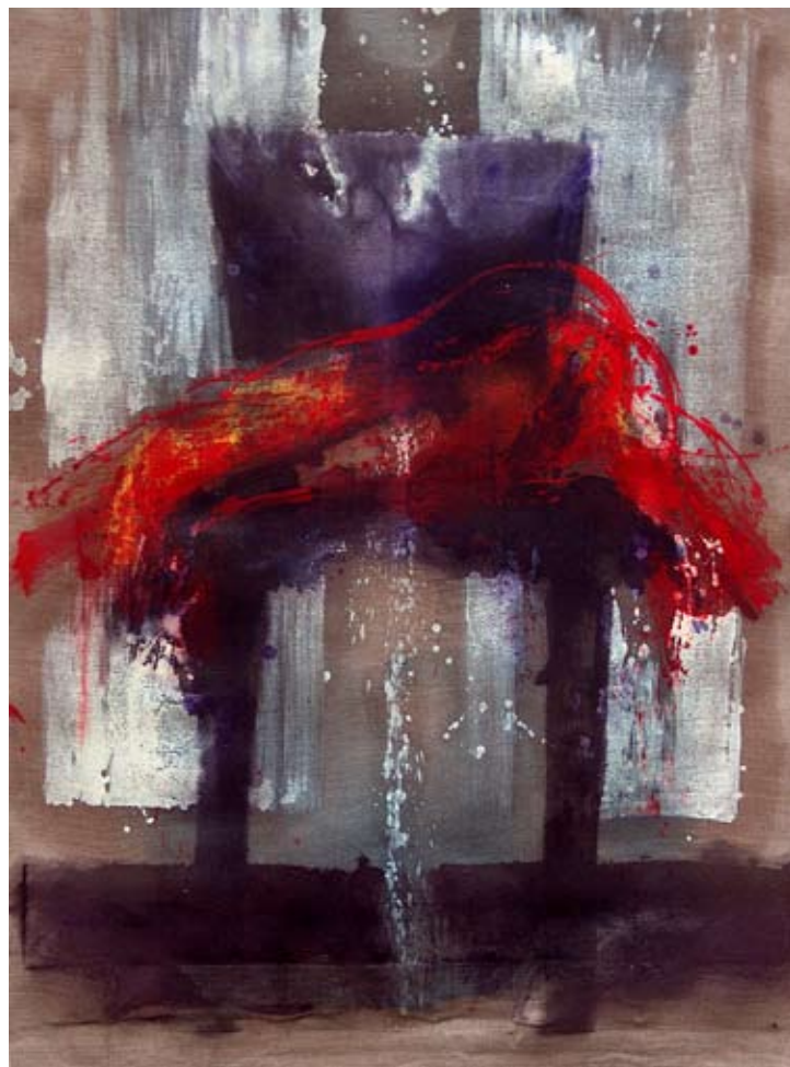
ELISABETTA TAGLIABUE "Cappotto II", cm 114x94, olio su tela, 2009