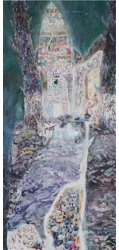
MARCO CASSANI "H.O.M.E. - Titanic", cm 149,5x 67,5, olio su tela 2009