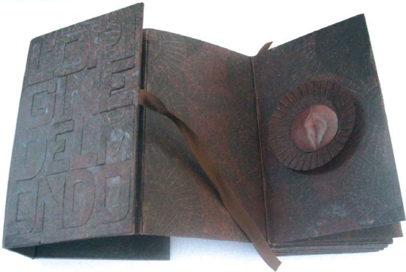
ROSSELLA ROLI "L'origine del mondo", cm 15x9,3x4, cartoncini, pirottini di carta, acquarelli, 2006