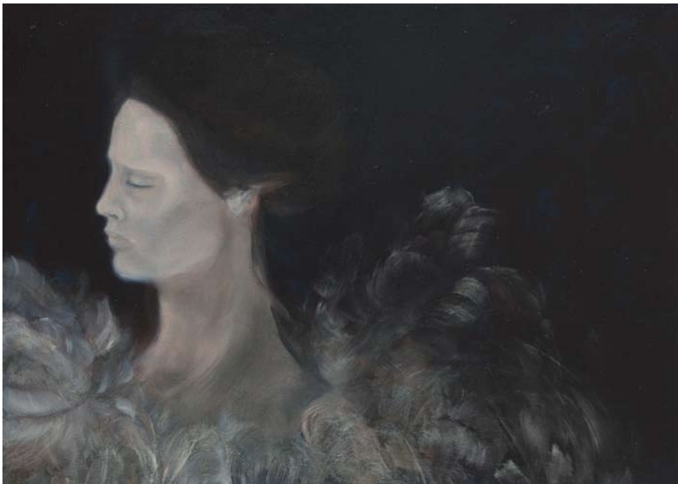
SIMONA BRAMATI "Venere", cm 50x70, tecnica mista su tela, 2009