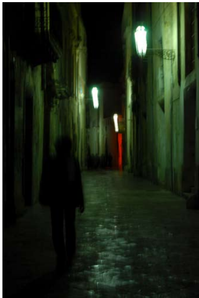
MARINA GIANNONI "Luces urbis 106-142", cm 42x28, light-box 2008