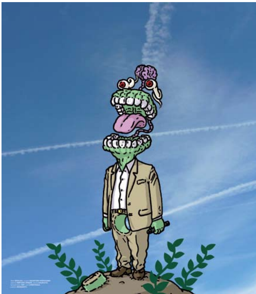
DARIO ARCIDIACONO "Uomo scomposto + scie chimiche", cm 75x85, acrilico su plexiglas + foto, 2009