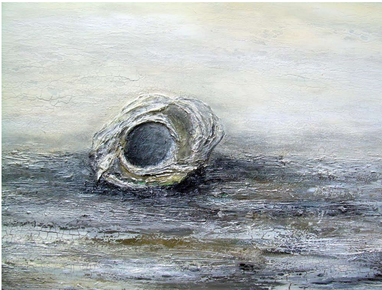
SABRINA RAVANELLI "Ventunogiugno", cm 120x100, tecnica mista, 2009