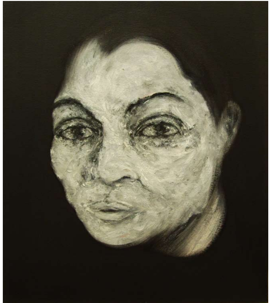
LORENZO PUGLISI "XXXI", cm 80x70, olio su tela, 2008