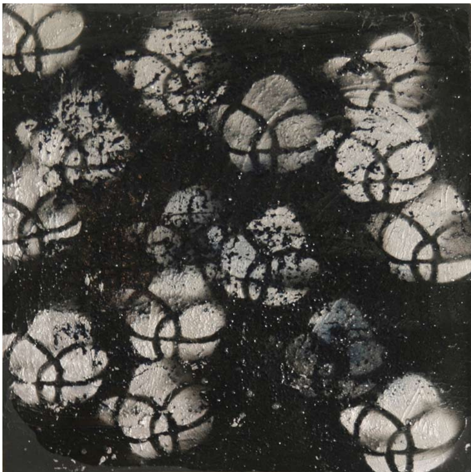
MICHELA POMARO "Quindici lune", cm 50x50, acrilici, pigmenti, ossidi e vinilici su tela, 2009