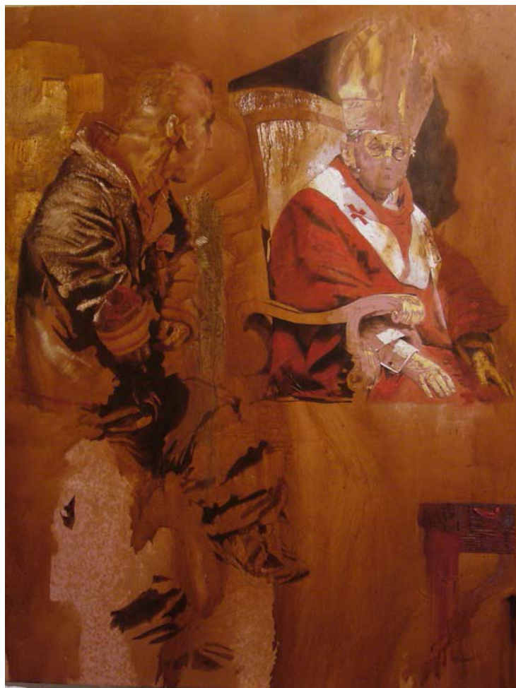
CLAUDIO MAGRASSI "Mercilessly", cm 130x150, olio su tela, 2009