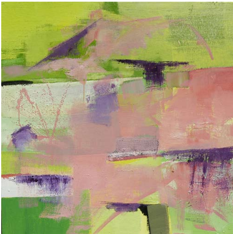
PAOLO MANAZZA "Light Spring", cm 80x80, olio su tela, 2009