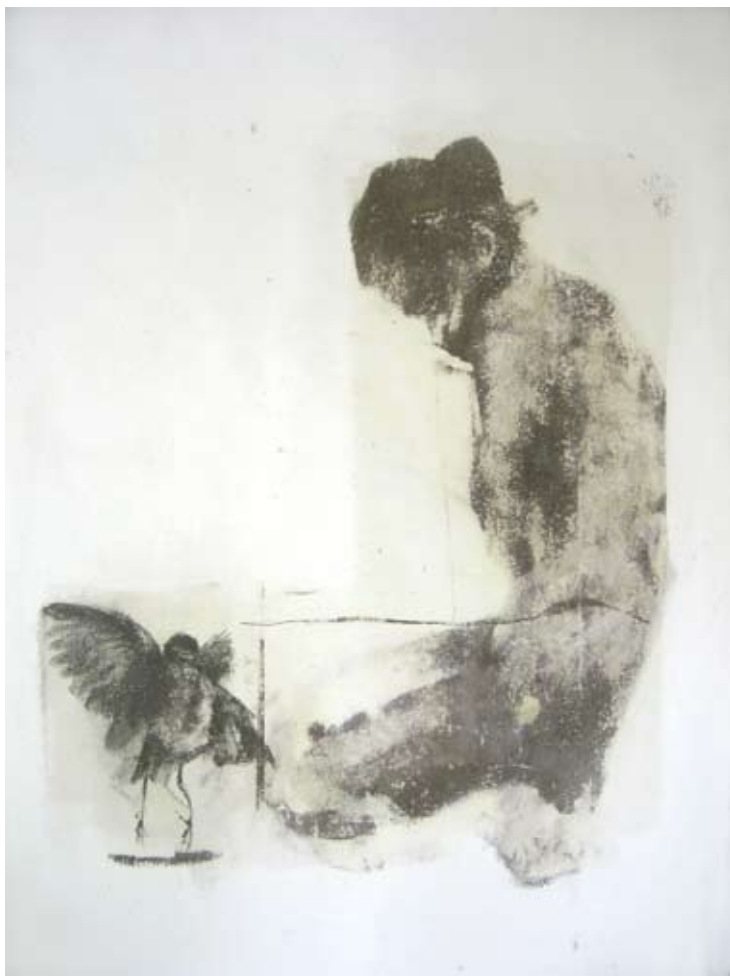
VIRGINIA LOPEZ "Martirologio", cm 100x70, gbc e grafite su carta, 2009