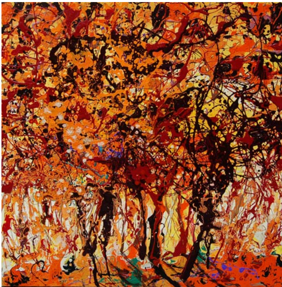
CRISTINA LEFTER "Incandescente bosco", cm 80x80, smalto e olio su tela, 2009