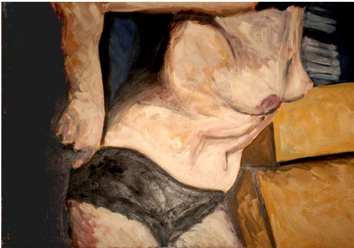
MIMMO DI MARZIO "La zia non viene mai a trovarci", cm 100x80, olio su tela, 2009