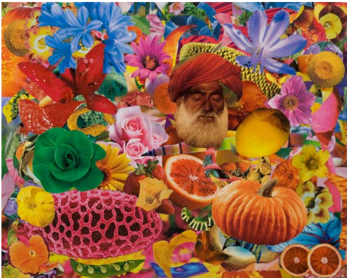
FELIPE CARDENA "Power Flower n. 40", cm 24x30, collage su tela, 2009