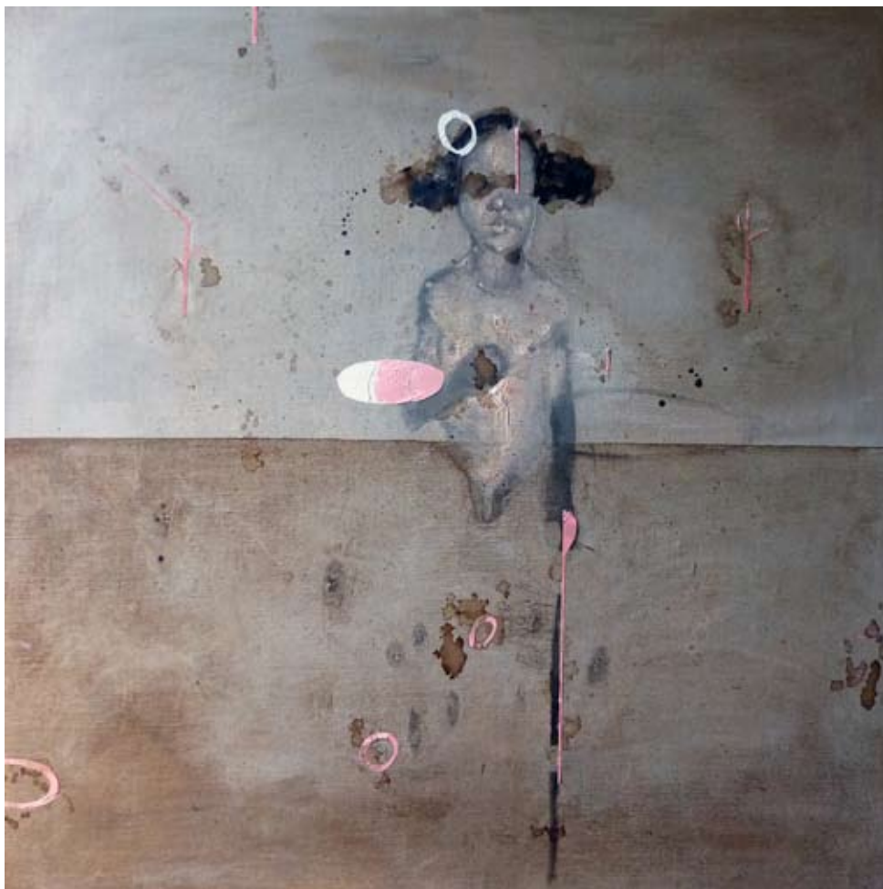
GIUSEPPE BOMBACI "The apparition", cm 100x100, olio su canapa preparata a gesso, 2009