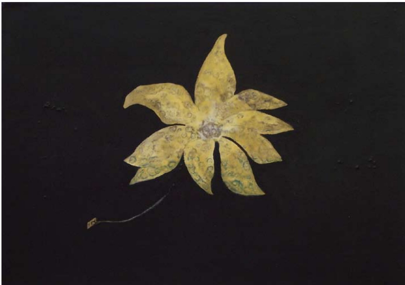
CLAUDIA ZURIATO " Un fiore di presa ", cm 68x48, ferro inciso, aniline, resine poliplastiche su tavola, 2009