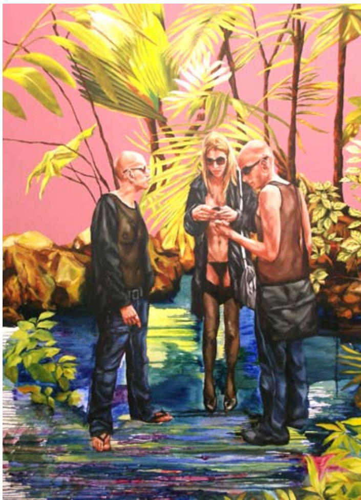
KOROO "Twins", cm 120x150, olio e acrilico su tela, 2009