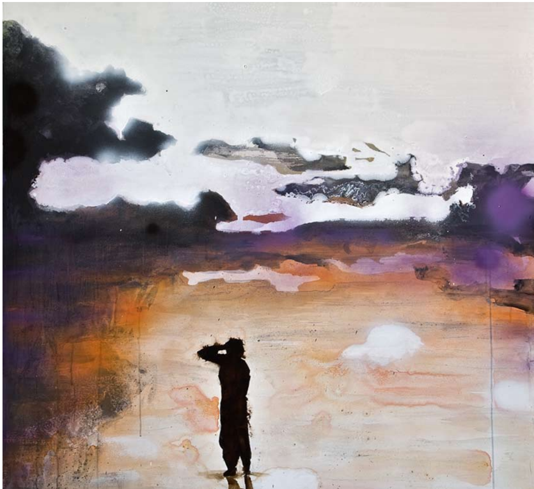
ELEONORA ROSSI "Day after", cm 120x130, acrilico, spray e bitume su tela, 2008