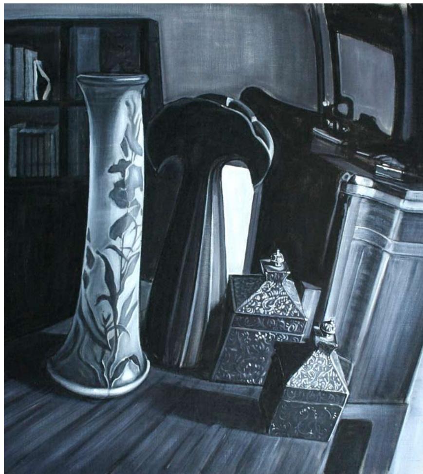
ANNALISA PIROVANO "Natura morta", cm 65x70, olio su tela, 2009