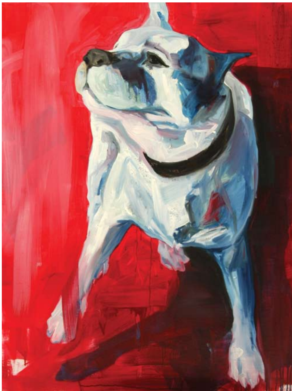
"PT 123" Olio su tela cm 120 x 90 ( luglio 2006 )