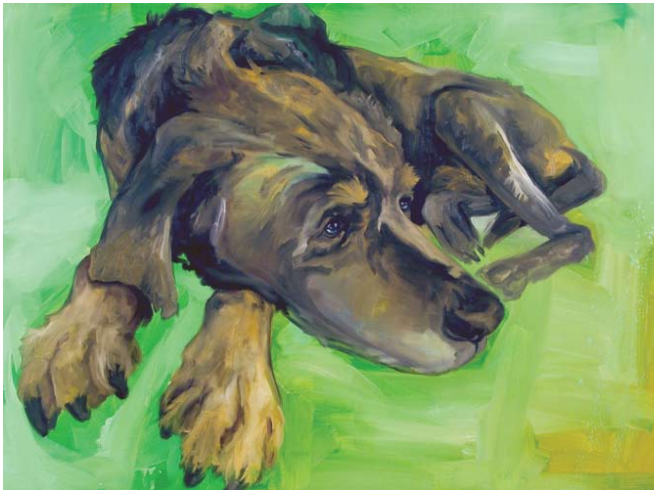
“ BD 012” Olio su tela cm 90 x120 ( dicembre 2006 )