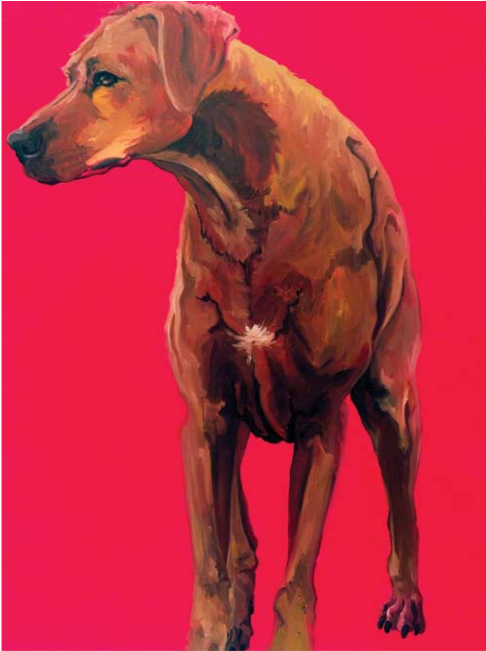
“ GD 644” Olio su tela cm 120 x 90 ( dicembre 2006 )