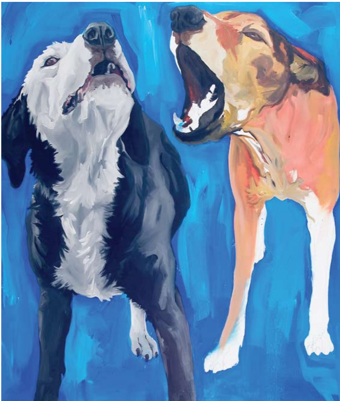
" BDS 333" Olio su tela cm 150 x120 ( dicembre 2006 )