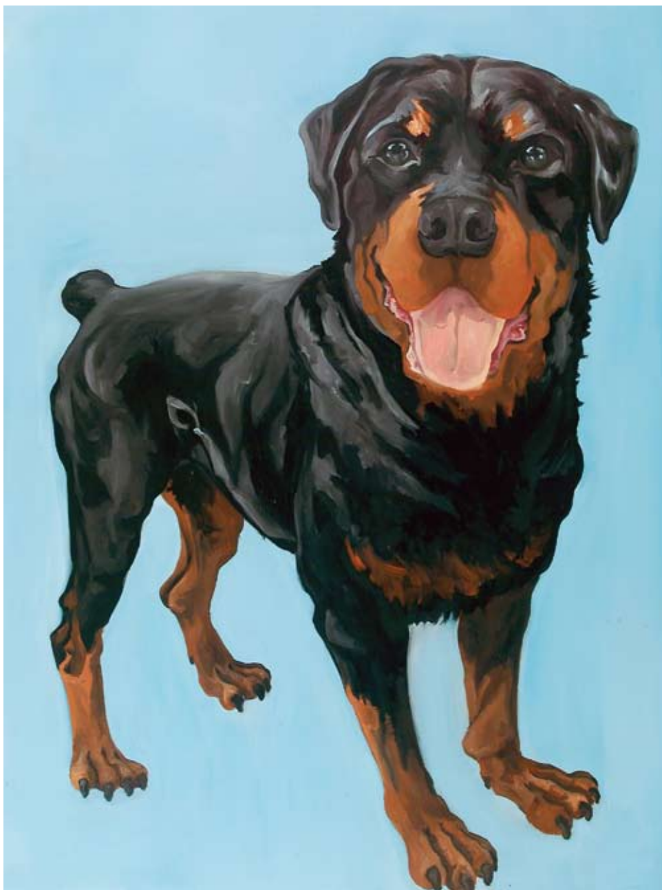
"RW 320" Olio su tela cm 120 x 90 ( dicembre 2006 )