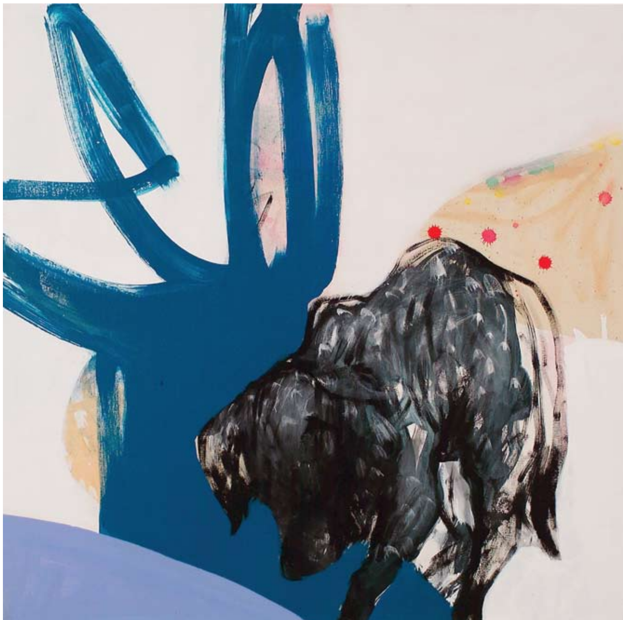
“SADNESS” - Acrilici su tela cm 80 x 80 (Dic. 2006)