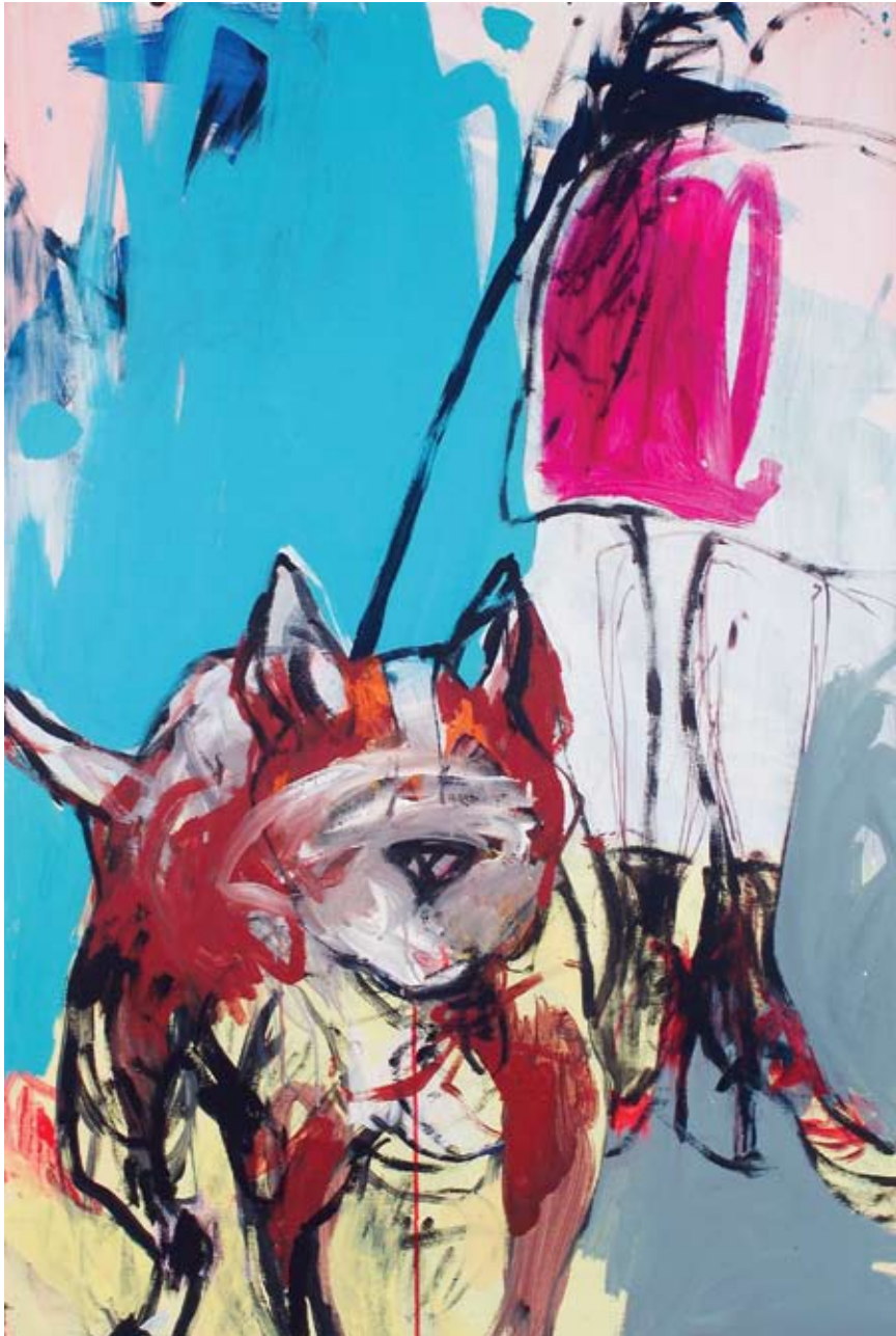
"AL GUINZAGLIO" - Acrilici su tela cm 70 x 100 (Dic. 2006)