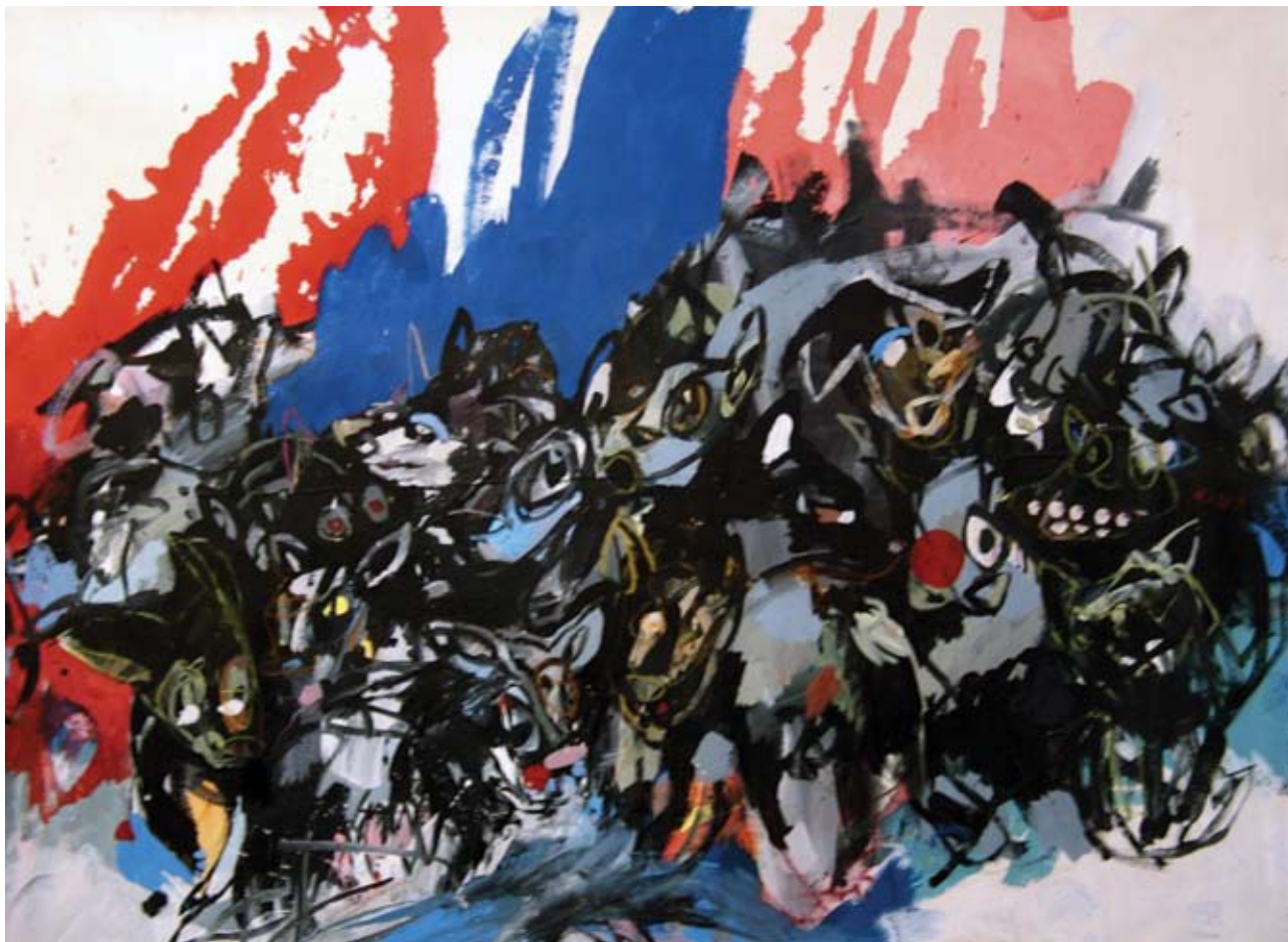
“BRANCO” - Acrilici su tela e pastelli ad olio cm 210 x 160 (ottobre 2006)