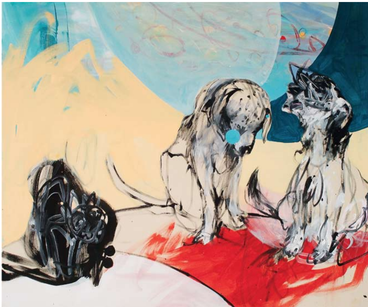
“LO SGRENFU” - Acrilici su tela cm 120 x 100 (Dic. 2006)