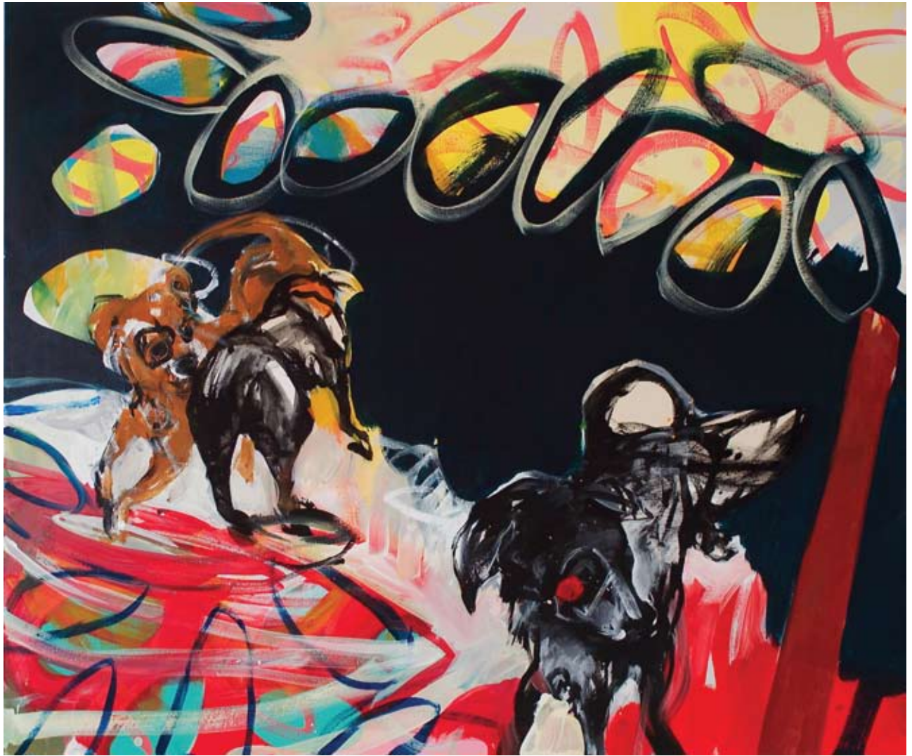
"LA GIOSTRA" - Acrilici su tela cm 120 x 100 (Dic. 2006)