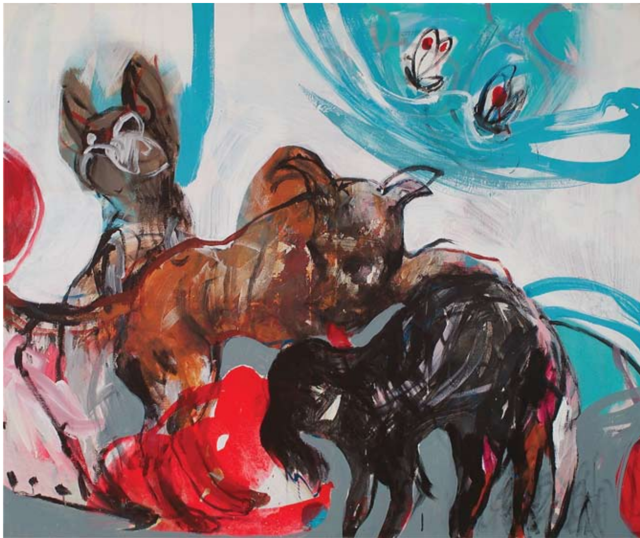
"INCONTRI" – Acrilici su tela cm 120 x 100 (Dic. 2006)