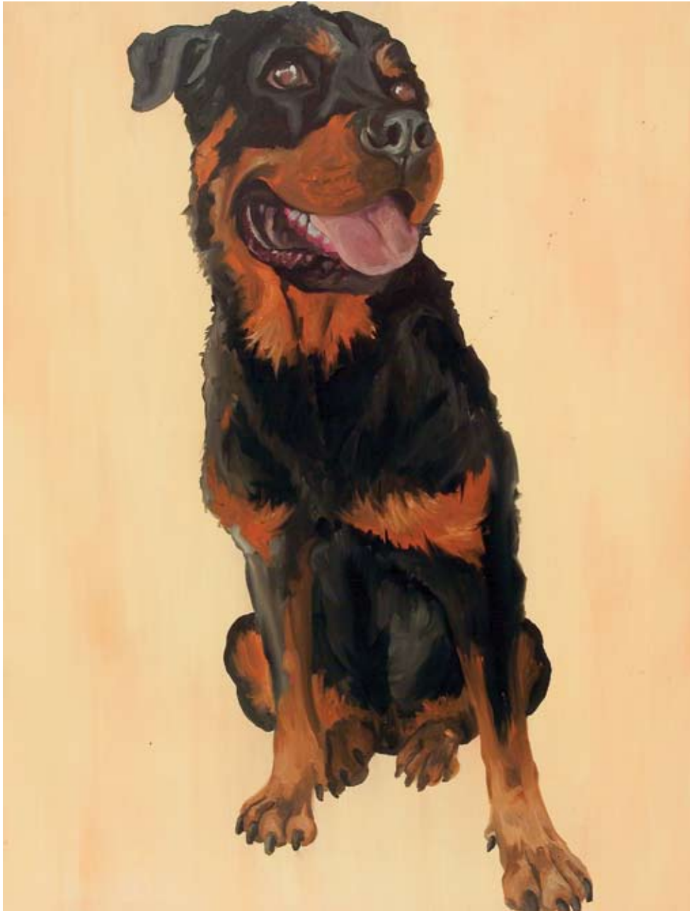
"RW 087" Olio su tela cm 90 x120 ( dicembre 2006 )