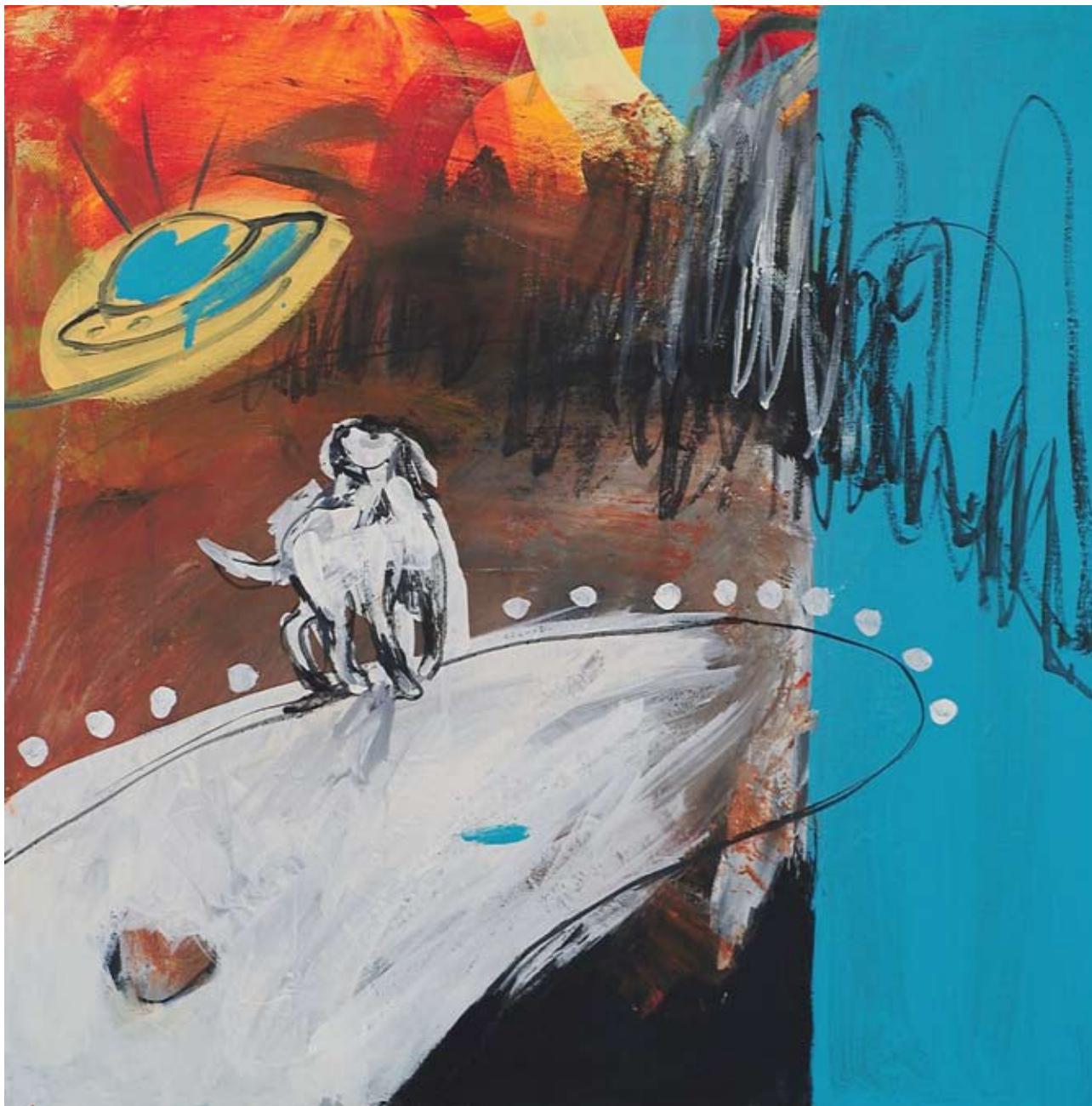
"DISCO DOG" - Acrilici su tela cm 50 x 50 (Dic. 2006)