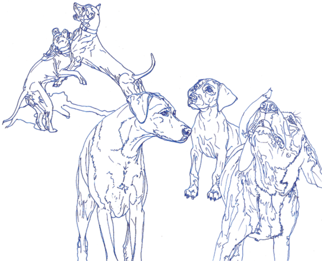
Disegni su acetato - misure variabili